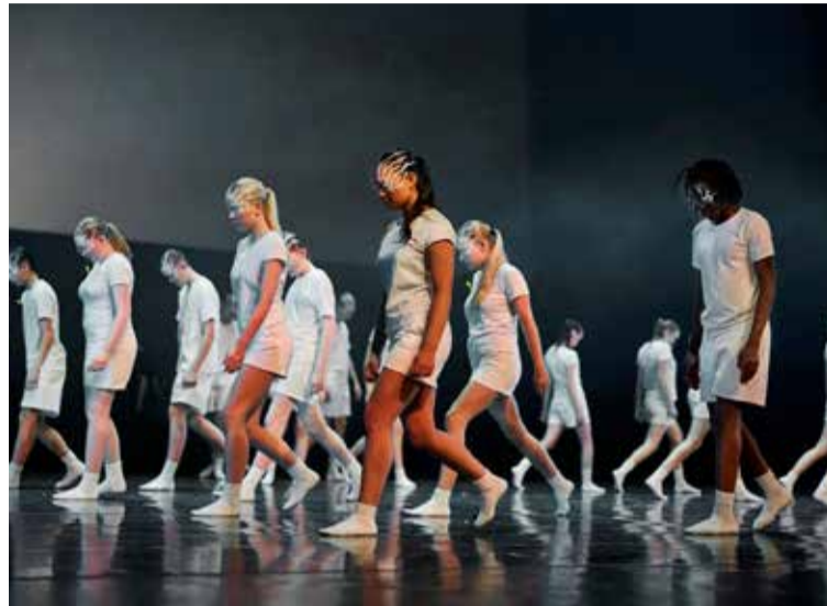
Frá Skrekk, hæfileikakeppni grunnskólanna sem Hagaskóli vann.

Háteigsskóli hlaut annað sætið og Seljaskóli það þriðja. Í Skrekk fá unglingar í grunnskólum Reykjavíkurborgar að útfæra og vinna með hugmyndirnar sínar og þróa sviðsverk fyrir stóra svið Borgarleikhússins. Þar nýta unglingarnir allar sviðslistir við verkin; tónlist, dans, leiklist og gjörninga. Sömmuleiðis sjá þau um tæknimál, búninga, förðun, semja leik, dans, söng, tónlist og söguþráð. Það er ljóst að framtíð sviðslista er björt og óskum við Hagskælingum og öllum keppendum Skrekks hjartanlega til