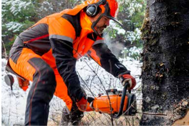
Dagur B. Eggertsson borgarstjóri sagar Oslóartréið sem var tekið í Heiðmörk.