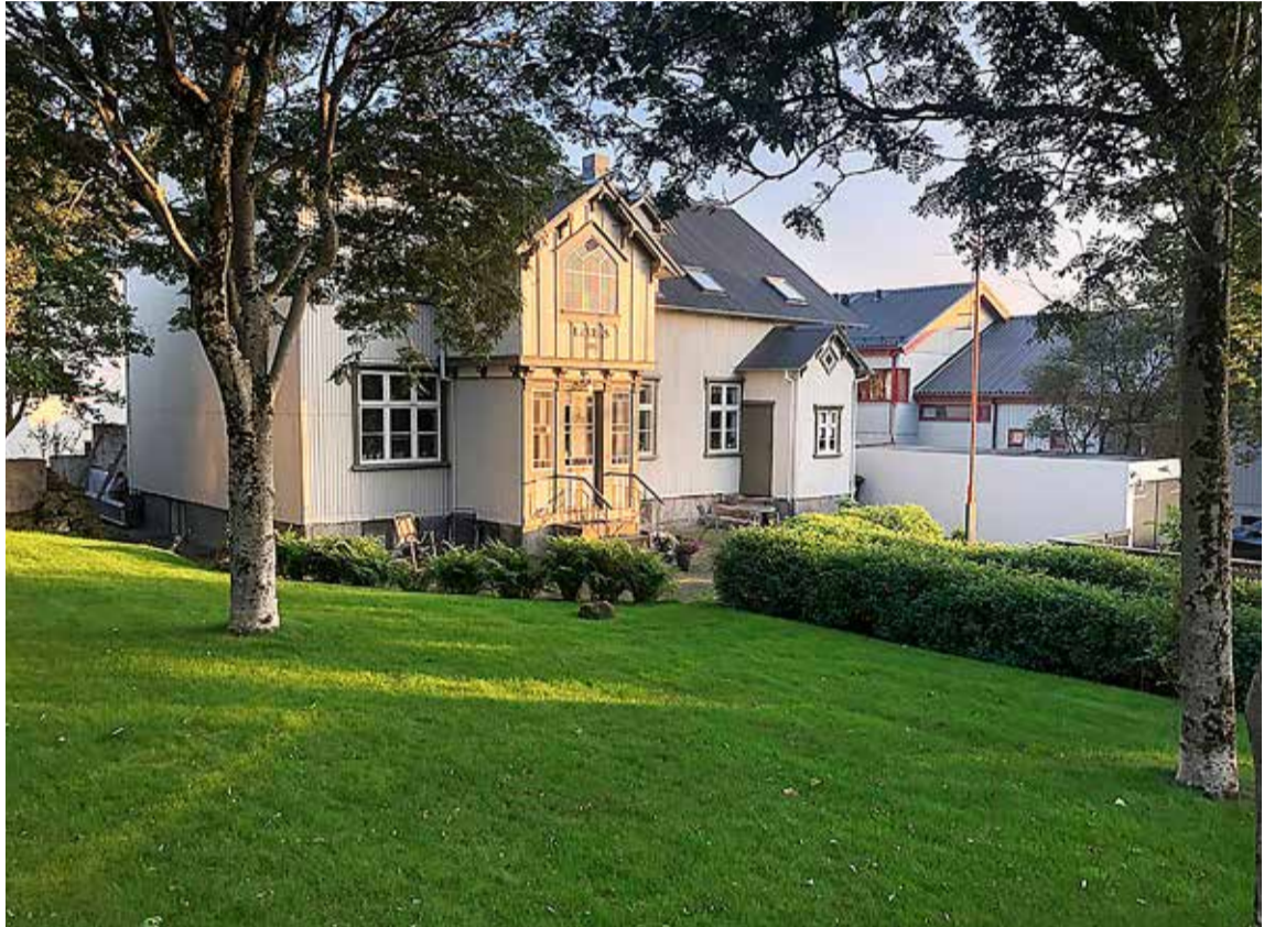
Laufásvegur 48 er í raun bakhús frá Laufásvegi og gengið inn frá Bragagötu.