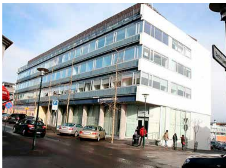
Vesturmiðstöð áður þjónustumiðstöð Vesturbæjar, Miðborgar og Hlíða er við Laugaveg 77 þar sem Landsbankinn var lengi til húsa með hluta af starfsemi sinni.