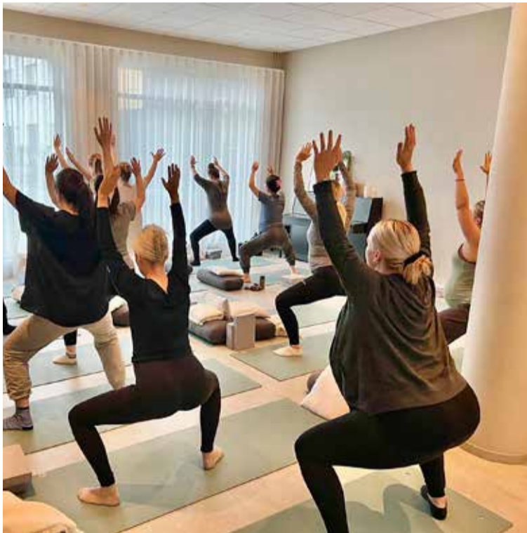
Boðið er upp á hreyfingu og jóga í undirbúningstímum fyrir fæðingu.

Sú nýjung sem við erum að móta er að bjóða upp á stað þar sem fleira er að finna en eingöngu ljósmæðraþjónustu. Við bjóðum upp á jóгатíma, brjóstaráðgjöf, bjóðum nudd, nálastungur og erum með ýmis námskeið á íslensku, ensku og pólsku.