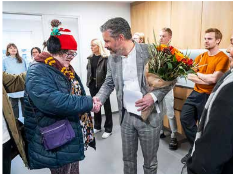
Dagur óskar tilvonandi íbúa til hamingju.