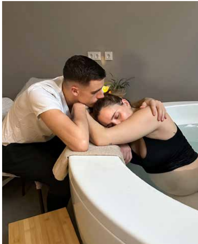
Fæður eru undantekningalítið viðstaddir fæðingu barna á fæðingarheimilinu og fæðingar í vatni fara öðru hvoru fram.