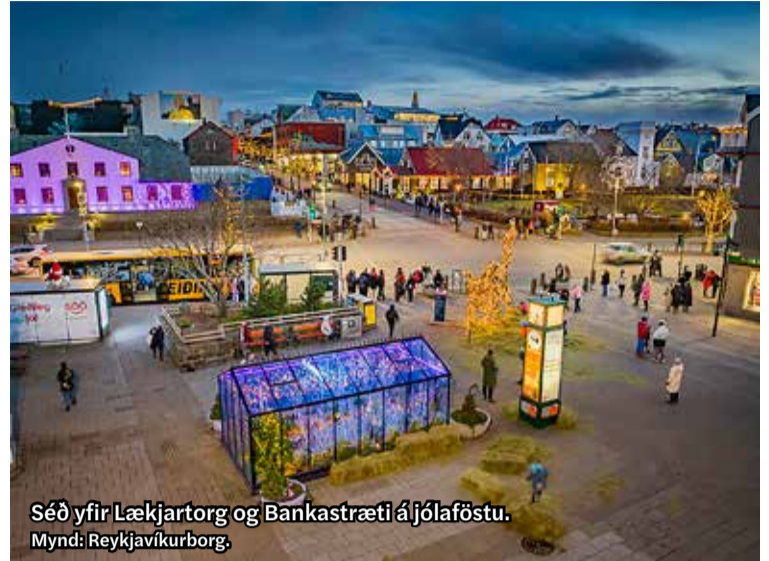
Séð yfir Lækjartorg og Bankastræti á jólaföstu.

Miðborgin Reykjavík- markaðsfélag var stofnað formlega af rekstraradilum í miðborginni í maímánuði þessa árs, 2023, en undirbúningur hafði staðið yfir í nokkurn tíma. Félagið stuðlar að því að miðborgin sé áhugaverður og aðlaðandi dvalar- og áfangastaður fyrir íbúa og aðra hagsmunaaðila borgarinnar, landsmenn alla og erlenda gesti. Markmið er að efla verslun, þjónustu, mannlíf og menningu í miðborginni. Samningurinn er gerður með fyrirvara um gildandi fjárhagsáætlun á samningstíma og er markmið hans að efla samstarf og upplýsingagjöf og vinna að sameiginlegum markmiðum. Einnig að vinna sameiginlega að ýmsum mállefnum