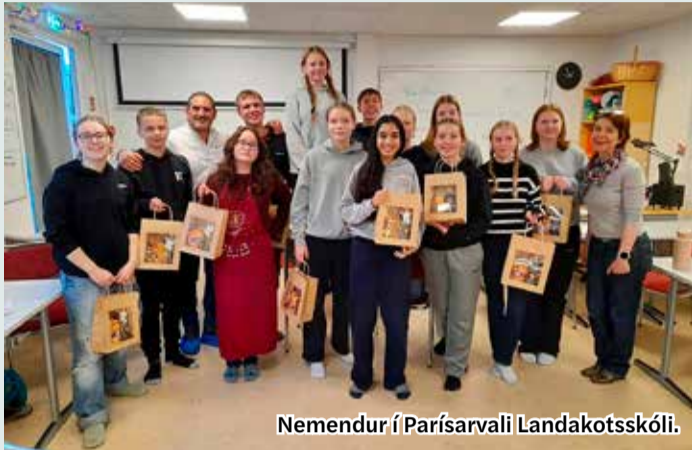
Nemendur í Parísarvali Landakotsskóli.

Nemendur á unglingsstigi skólans geta valið Parísarval, Þá læra nemendur auk frönsku margt um menningu og listir Frakka. Námskeiðinu lýkur svo með menningarferð til Parísar.